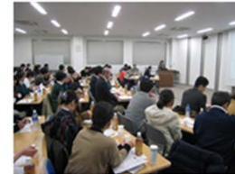
第4回勉強会の様子(平成29年2月24日)